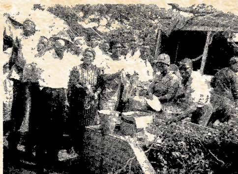
A Happy Group of Master Guide Campers Washing Dishes After Lunch.