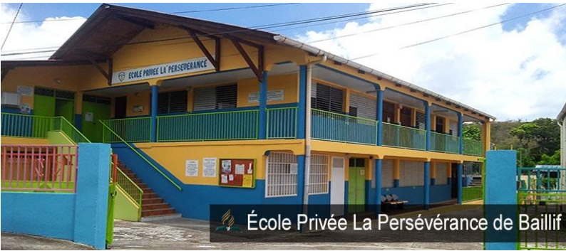
École Privée La Persévérance de Baillif