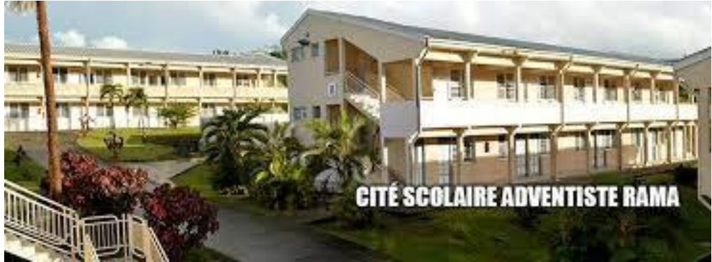
CITÉ SCOLAIRE ADVENTISTE RAMA